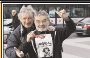
Hommage à Fernando Arrabal pour ses 80 ans