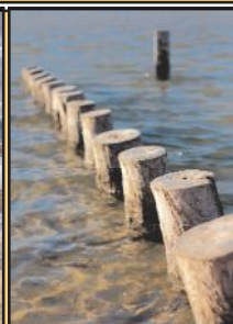
Camargue, alchimie de la terre et de l'eau Vincent RECORDIER