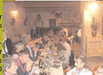
Soirée Gers, novembre 2011